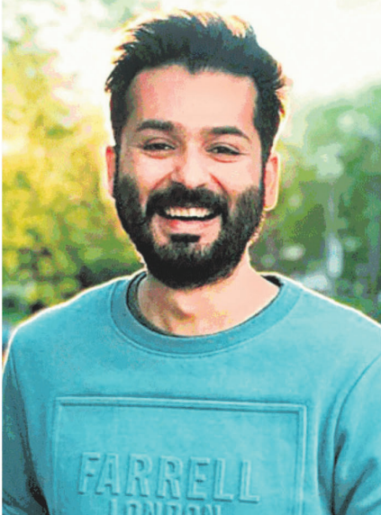
మరో ప్రతి సినిమా ఒక సాహసమే' అని పేర్కొన్నాడు.

బాలీవుడ్ స్టార్ రణవీర్ సింగ్ ప్రధాన పాత్రలో ఆదిత్యధర్ దర్శకత్వంలో తెరకెక్కిన ధురంధర్: ది రివెంజ్ విడుదలకు సిద్ధమైంది. మార్చి 19న ప్రపంచ వ్యాప్తంగా ప్రేక్షకుల ముందుకు రానుంది. ప్రస్తుతం ఈ మూవీ పనుల్లో బిజీగా ఉన్న దర్శకుడు తన పుట్టిన రోజున కూడా సినిమాకు తుది మెరుగులు దిద్దే పనిలో ఉన్నట్లు చెప్పాడు. మొదటి భాగాన్ని సూపర్ హిట్ చేసిన ప్రేక్షకులకు ధన్యవాదాలు తెలుపుతూ సోషల్ మీడియాలో పోస్ట్ పెట్టాడు. ఇన్నాళ్లు తన పనిపై ప్రేక్షకులు చూపిన నమ్మకానికి రుణపడి ఉంటానన్నాడు. 'మీ మెస్సేజ్ లు, పోస్టులు, స్టోరీలు చూస్తుంటే నా హృదయం నిండిపోతోంది. అందరికీ పర్సనల్ గా సమాధానం చెప్పాలని ఉన్నా కుదరడం లేదు. నేను పొందే అనుభూతి మాట్లాడే చెప్పలేక పోతున్నా. నిజంగా అదృష్టవంతుడిని. గ్యారంటీ లేని ఈ చిత్రపరిశ్ర